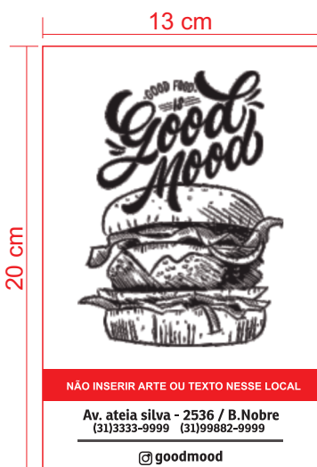
Página 1 (Frente)