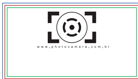
Página 02 (Verniz da Frente) Obs.: 100% de preto(k) em vetor