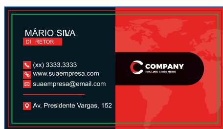
Página 01 (Impressão Frente)