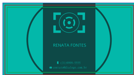
Página 03 (Impressão Verso)