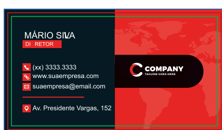
Página 01 (Impressão Frente)