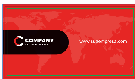
Página 02 (Impressão Verso)

*Atenção: A grade 4x1 o verso tem que ser enviado somente com porcentagem de preto(k)