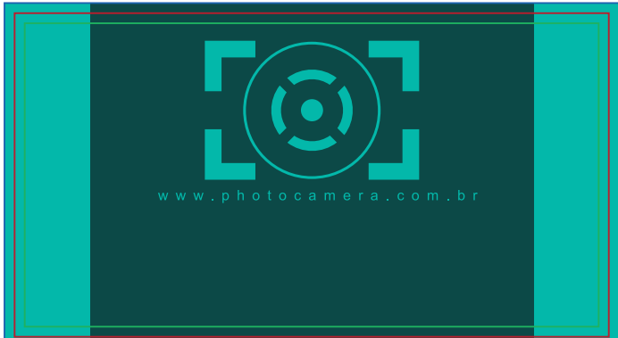
Página 01 (Impressão Frente)