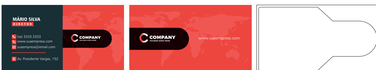
Página 01 (Frente)

Para cartões com faca/corte especial, deve-se acrescentar mais um página ao final do arquivo contendo o desenho de corte vetorizado com preenchimento da linha 100% preto. O tamanho máximo para o corte especial em cartões de visita é 88x48mm. Evite desenhos complexos ou facas vazadas, este tipo de acabamento pode prejudicar o resultado final do seu produto. Veja abaixo um exemplo para montar seu arquivo: