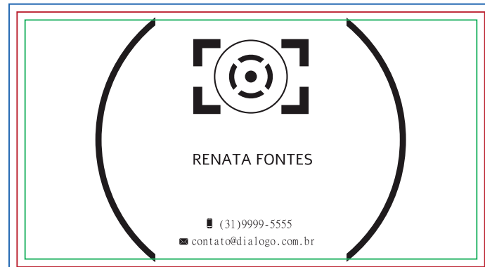
Página 04 (Verniz do Verso) Obs.: 100% de preto(k) em vetor