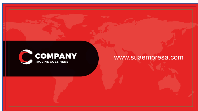
Página 02 (Impressão Verso)

*Atenção: A grade 4x1 o verso tem que ser enviado somente com porcentagem de preto(k)