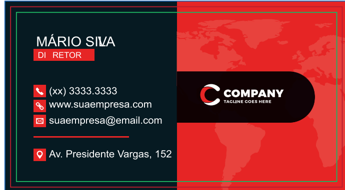
Página 01 (Impressão Frente)