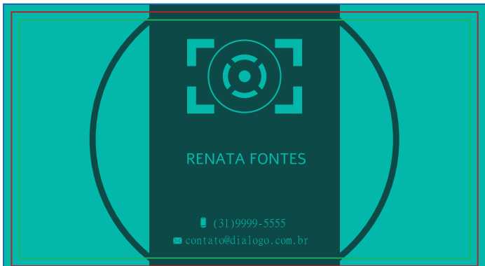
Página 03 (Impressão Verso)