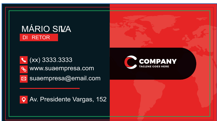
Página 01 (Impressão Frente)